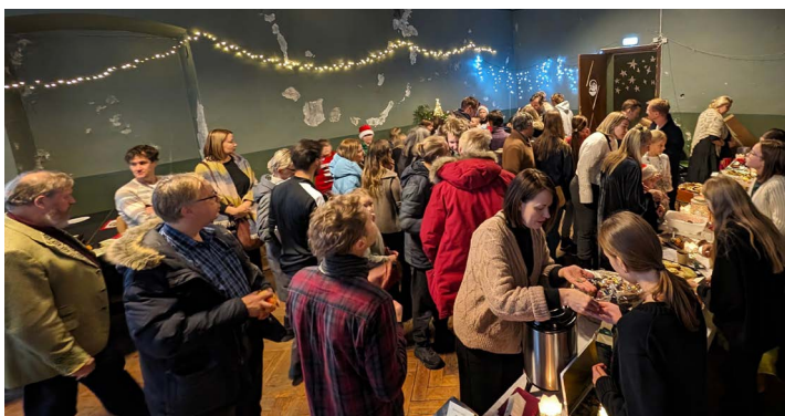
5. klasside kohvik