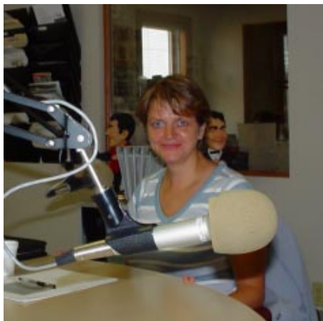
Meie erikorrespondendi esimesed sammud üle-Ameerikalise tuntuse võitmise teel: 14. septembril väikelinna Morrise raadios intervjuud andmas.