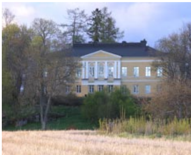
Moisio mõis, mille on kavandanud Karl Ludvig Engel