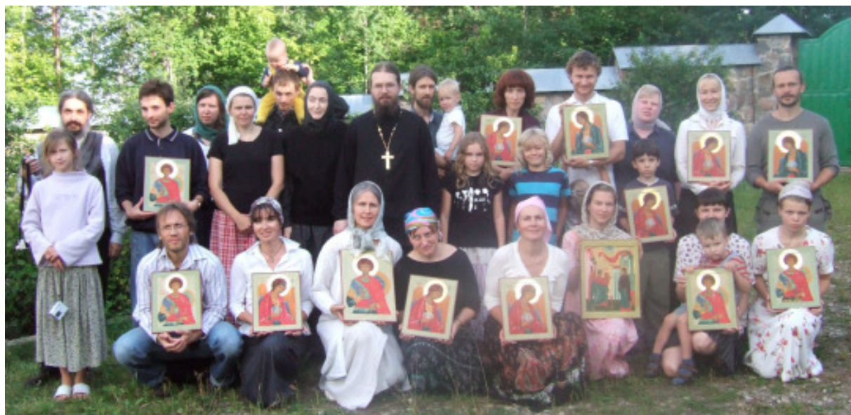
Ikoonimaalijad Kuremäel oma värskelt valminud Püha Miikaeli ikoonidega

VIRGELT on võimalik jälle osta mett. 0,5-liitrine - 50 krooni, 0,7-liitrine - 70 krooni. Kohe oleks anda 0,7-liitriseid purke.