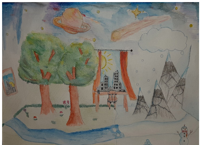
„Maailm kodus“, Simona Rehepapp, PMK 4.T